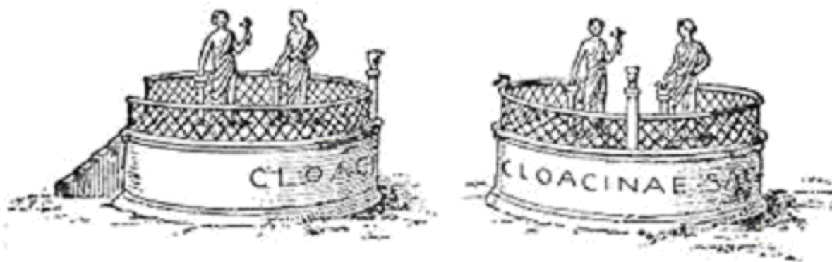
Figura 3 Reconstituire grafică a altarului Sacrum Cloacinae

În fața basilicii Aemilia, era construit altarul zeiței Venus Cloacina, numit Sacrum Cloacinae, deasupra confluenței dintre canalul ce drenează Forul și canalul principal al sistemului de canalizare. Nu se cunoaște data exactă a construirii acestui altar, însă istoricii îl atribuie perioadei regatului, cel mai probabil domniei regelui Titus Tatius 6 . Titus Livius îl menționează în anul 451 î. Hr, când centurionul Virginius își ucide fiica Verginia 7 în fața altarului.