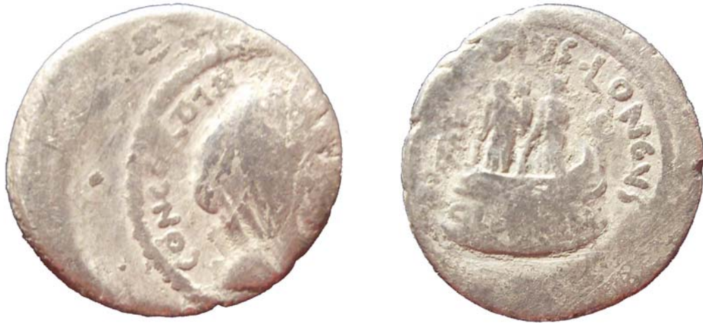
Figura 1 Denar L. Mussidius Longus 42 î.Hr.