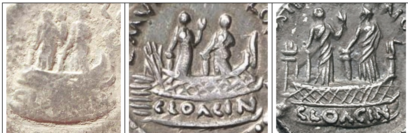
Figura 4 Altarul Sacrum Cloacinae reprezentat pe denarii lui Mussidius Longus

În imaginea nr. 3 am ilustrat o încercare de reconstituire grafică a Sacrum Cloacinae, așa cum reiese din imaginile păstrate pe monede. Aspectul său era circular, și consta dintr-o fundație din marmură cu diametrul de 2,4 m, având o balustradă metalică, și niște trepte de acces în partea laterală. Era ocupat de două statui, una dintre ele fiind a lui Venus, iar ce-a de-a doua e neidentificată (probabil Cloaca Maxima). În zilele noastre se păstrează doar fundația, ce prezintă urme de înălțare succesivă în mai multe rânduri în ritm cu modernizarea forului. În imaginea