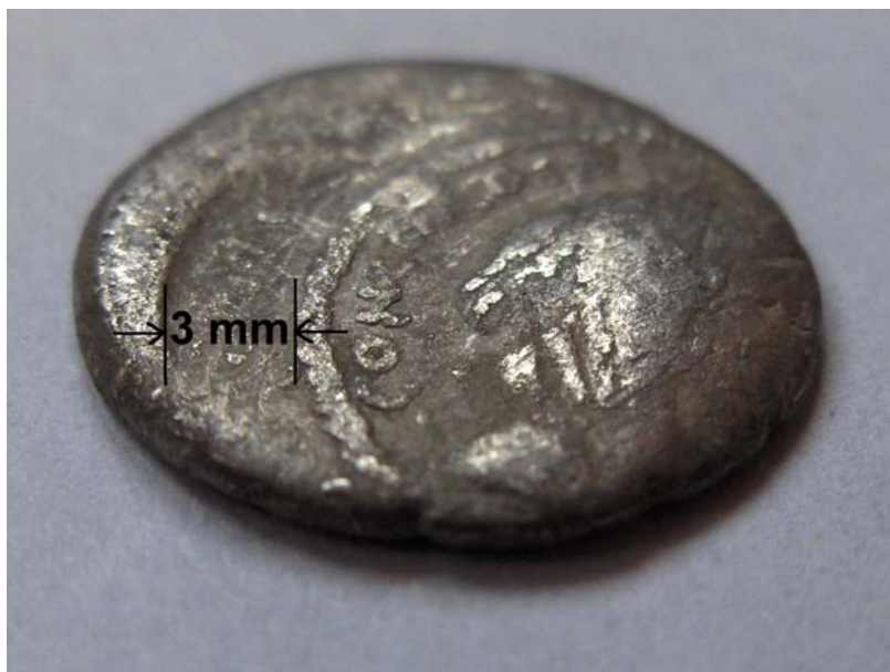
Figura 6 Rezultatul deplasării ștanței de avers

Faptul că ștanța de avers este deplasată față de cea de revers ne relevă un aspect legat de procesul tehnologic al baterii piesei, și anume grosimea matriței utilizate la baterea acesteia. Putem astfel să ne imaginăm dimensiunea ștanțelor. Baterea monedei cu matrița de avers deplasată a scos la iveală șanțul lăsat de către marginea ștanței de revers, lată de 3 mm, în pastila monetară. De pe revers am reușit să măsurăm și diametrul cercului perlat ce încadrează câmpul monetar, acesta fiind de 14 mm. Astfel denarul nostru a fost bătut cu o ștanță având diametrul exterior de 20 mm și cel interior de 14 mm.